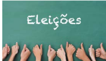
DILMA NA FRENTE – 6 Numa disputa entre Dilma e Aécio, a presidenta também vence com 49% das intenções de voto contra 34% do senador.

Trabalhadores em mais três fábricas da base fizeram assembleias ontem para pressionar os patrões a melhorar suas propostas na Campanha Salarial 2014. Os atos aconteceram na Toledo e ZF, em São Bernardo, e na Dura Automotiva, em Rio Grande da Serra.