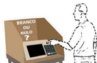
DILMA NA FRENTE – 3 Os votos brancos e nulos são 6%, os eleitores indecisos totalizam 12%. Somados, os demais candidatos representam apenas 2% dos votos.