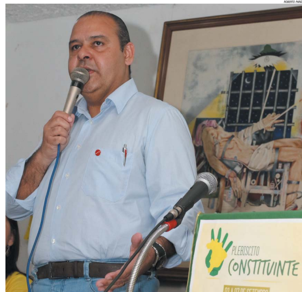
Mais de quatro mil cidadãos, de todo o Brasil, receberam as 40 mil urnas destinadas à votação popular. No ABC, a Comissão da Juventude Metalúrgica do ABC apoiou e se envolveu nos debates sobre a Reforma Política.