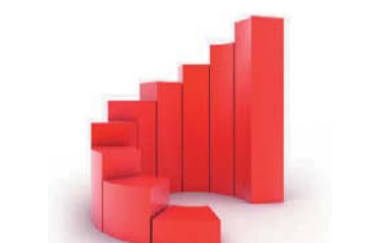
DILMA NA FRENTE – 2 A presidenta passou de 36% para 40% das intenções de voto enquanto a ex-senadora caiu de 27% para 22%. Aécio tem 17%.