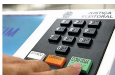
DILMA NA FRENTE – 4 Dilma superou Marina também nas simulações de segundo turno, onde aparece com 46% da preferência contra 39% da ex-senadora.